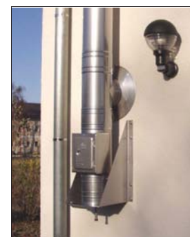
Montage auf Wandkonsole