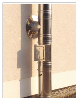
Montage auf Schornsteinsockel