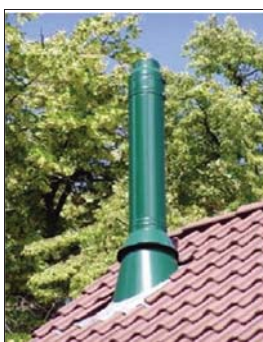
Dachdurchführung mit Blei